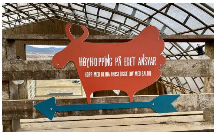
Fine skilt med informasjon om dyrene og aktivitetene på Grytebakke gård.

Grytebakke gård tilbyr også et supplerende opplæringstilbud der man kobler teoretiske fag opp mot praktisk læring som har til hensikt å få elevene til å oppleve mestring og glede. Gården tar imot elever i grunn- og videregående skole. Elevene kan ha fulltids- eller deltids plass på gården. I samarbeid med skolen utvikles en egen individuell opplæringsplan, og man blir enig om skolen skal stille med eget personale. Aktiviteter som kan tilbys er turer i skogen, ekspedisjon i elva, elevene kan være med på jakt, de kan mekke på mekaniske kjøretøy i verkstedet eller lage ting i snekkerverkstedet. Gården tilbyr også mulighet for å øvelseskjøring for bil, lett motorsykkel og traktor.