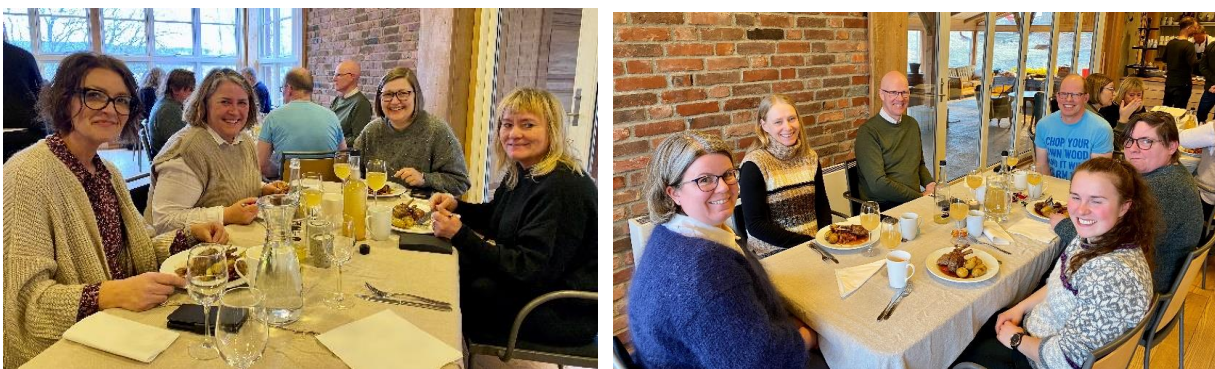
God stemning rundt middagsbordene på Abildsø gård.

Abildsø gård kan vise til gode resultater og ser at elevene har stort utbytte av å ha et tilbud hos dem. Foreldrene rapporterer om en positiv utvikling knyttet til skolemotivasjon og til sosiale ferdigheter. Skolene ser at elevene har mindre fravær de øvrige dagene de er i ordinær skole. I innlegget som lærerne gav oss på studieturen, fortalte de også hva de ser på som bakenforliggende årsaker til at mange barn i dag sliter. De viste til at majoriteten har dårlig selvbilde og lav selvfølelse. Mange av elevene er deprimerte og ser på seg selv som et problem heller enn en ressurs. Mange elever har også en krevende familiesituasjon eller mangler et godt miljø utenfor skolen. Disse elevene har et behov for å bli sett og hørt, og erfare at de betyr noe. Med andre ord må man få til en positiv endring der elevene mestrer både det faglige og det sosiale, og kan ta gode valg. Dette vil kunne bidra til mindre vold og rus.