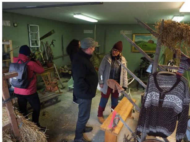
Til venstre: Superskogen er et aktivitetsområde med grillhytte, klatretøy mm. på Grytebakke gård. Til høyre: deltakerne besøker gårdsmuseet.