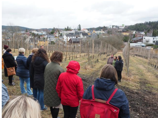
Til venstre: omvisning på Abildsø gård. Til høyre: Besøk i eplehagen til Abildsø gård.

Da vi kom innendørs, benyttet vi først anledningen til at alle deltakerne på studieturen fikk presentere seg selv, etterfulgt av at prosjektgruppa presenterte det nasjonale Inn på tunet-pilotprosjektet for Abildsø gård. Avslutningsvis presenterte hver av pilotkommunene noen av erfaringene de har så langt med arbeidet knyttet til Inn på tunet. Vi fikk deretter servert tre-retters middag og selvfølgelig smake på gårdens egen eplemost.