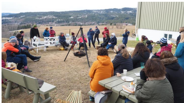
Til venstre: Jentene på Solberg gård. Til høyre: Informasjon fra Lier kommune, Solberg gård og Helgerud gård.

For flere av deltakerne på studieturen var det følelsesmessig sterkt å høre historiene til disse elevene, samtidig som vi fikk et godt inntrykk av at et tilbud på en Inn på tunet-gård én til to dager i uka, kan utgjøre en forskjell for elevene. Besøket ble avsluttet med lunsj ute rundt bålpannen, hvor Lier kommune orienterte om samarbeidet med både Solberg gård og Helgerud gård.