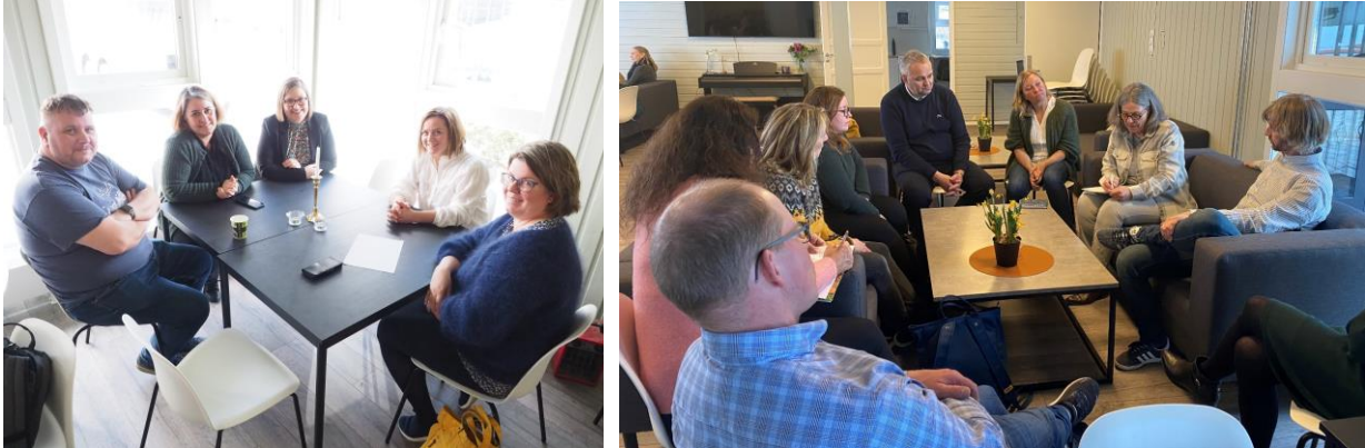
Gruppearbeid med erfaringsutveksling mellom pilotprosjektene deltakere og arbeidslaget i Kongsberg kommune.

Etter innledningen fra Kongsberg kommune ble deltakerne delt inn i grupper. Hver gruppe hadde minimum én fra arbeidslaget i Kongsberg, slik at deltakerne kunne stille spørsmål og få mer inngående kunnskap om arbeidslaget og rammeavtalen mm. Gruppearbeidet ble avsluttet med at alle gruppene kort presenterte hva deres gruppe hadde diskutert.