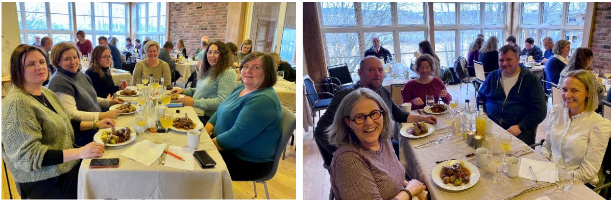
Deltakerne på studieturen fikk servert middag på Abildsø gård og fikk smake på deres egen eplemost.

En dagsplan på Abildsø gård starter alltid med at lærerne ønsker elevene velkommen før de spiser frokost sammen, og smører matpakke. For mange er det viktig å trene på å spise sammen og prate med andre (sosial ferdighetstrening). Fra kl. 10:15 har de ulik undervisning for de ulike gruppene, eksempelvis mat og helse, sløyd, natur og friluft, gårdsgruppe osv. Aktivitetene er de samme over en 3-ukersperiode før det rulleres. Elevene skriver også logg over hva de har gjort, hvem de har vært sammen med, og hva som har vært det beste med denne aktiviteten. Aktivitetene i gruppene innlemmer ulike fag og består i stor grad av praktisk læring.