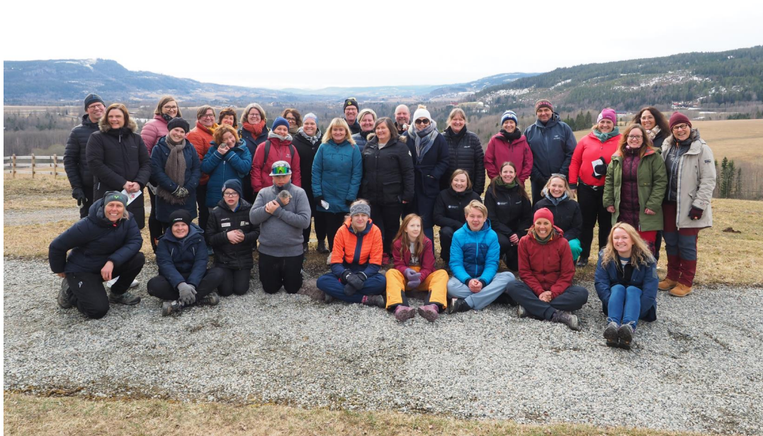
Alle deltakerne på Solberg gård, inklusive elevene, Inn på tunet-tilbydere og kjøper fra Lier kommune.

For flere av deltakerne på studieturen var det følelsesmessig sterkt å høre historiene til disse elevene, samtidig som vi fikk et godt inntrykk av at et tilbud på en Inn på tunet-gård én til to dager i uka, kan utgjøre en forskjell for elevene. Besøket ble avsluttet med lunsj ute rundt bålpannen, hvor Lier kommune orienterte om samarbeidet med både Solberg gård og Helgerud gård.